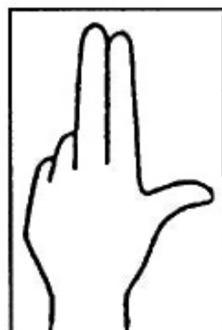
Fig. 7 / θ, g, f, ʃ /