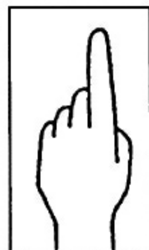
Fig. 1 / p, d /