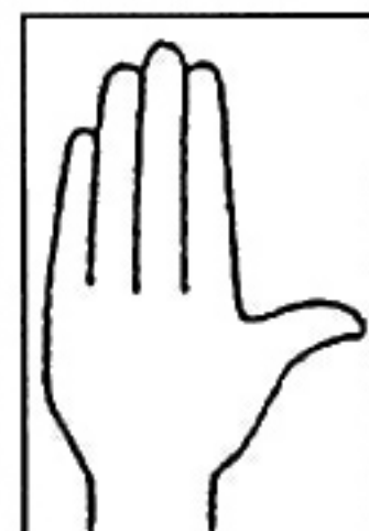
Fig. 5 / m, f, t, - /