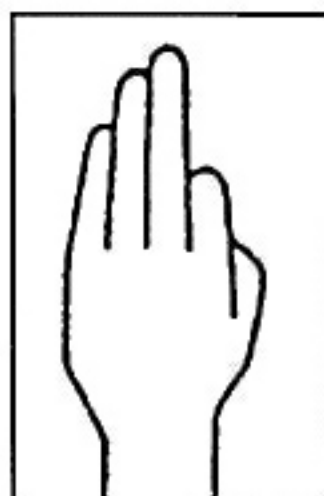
Fig. 3 / x, r, s /