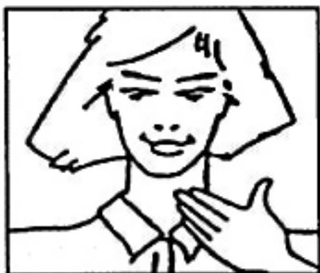
Posición garganta / i, u /