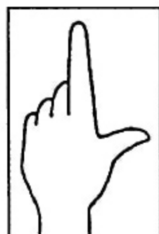
Fig. 6 / l, w /