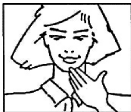
Posición barbilla / e, o /