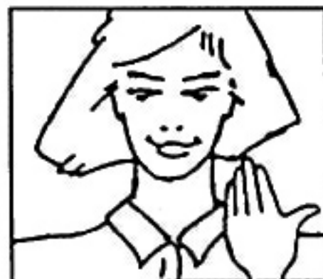
Posición lado / a /