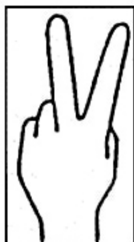
Fig. 8 / ç, j, ŋ /